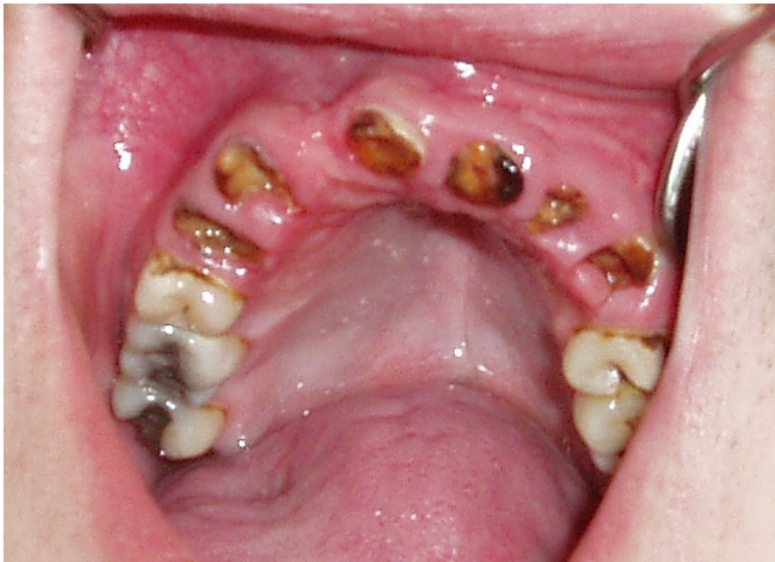
Abbildung 1: Klinisches Bild stark zerstörter Frontzähne. In dieser Situation bietet teilweise lediglich das Kanallumen Verankerungsmöglichkeiten für Zahnersatz.

Durch Karies oder Traumata kann ein Zahn derart geschädigt werden, dass bei einer Versorgung mit einer konventionellen plastischen Füllung oder einer Krone ohne Stiftstumpfaufbau keine gute Langzeitprognose mehr gegeben ist (Abbildung 1). In diesem Fall ist es indiziert, die Wurzelkanaloberfläche zur Verankerung der geplanten Restauration mit heranzuziehen.